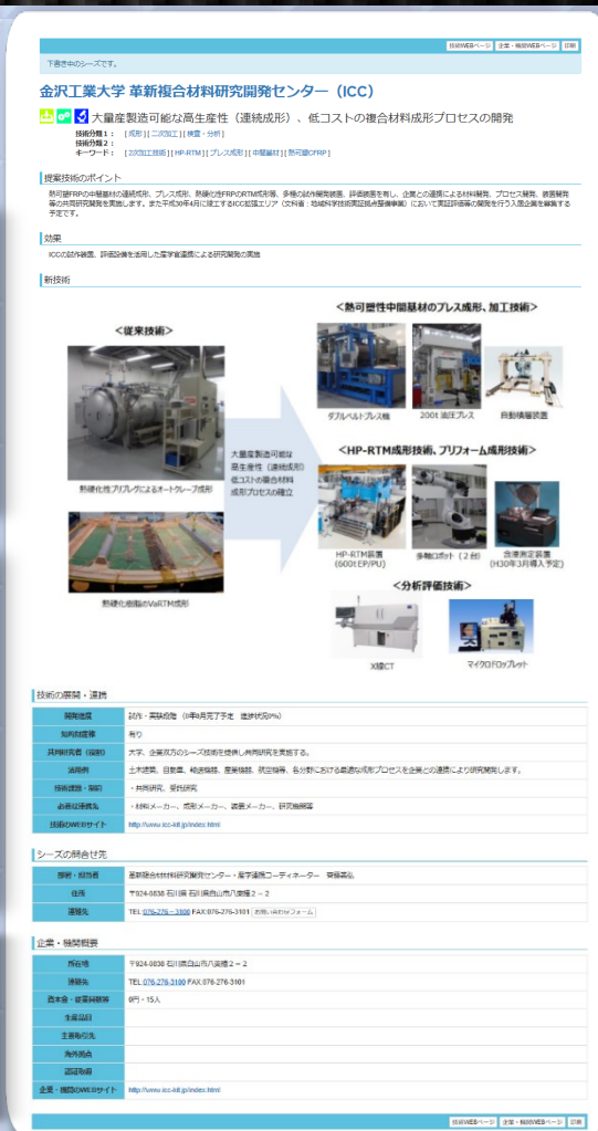
掲載例 金沢工業大学革新複合材料研究開発センター (ICC)